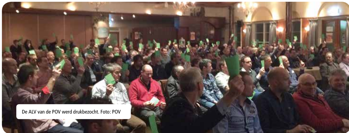
De ALV van de POV werd drukbezocht.