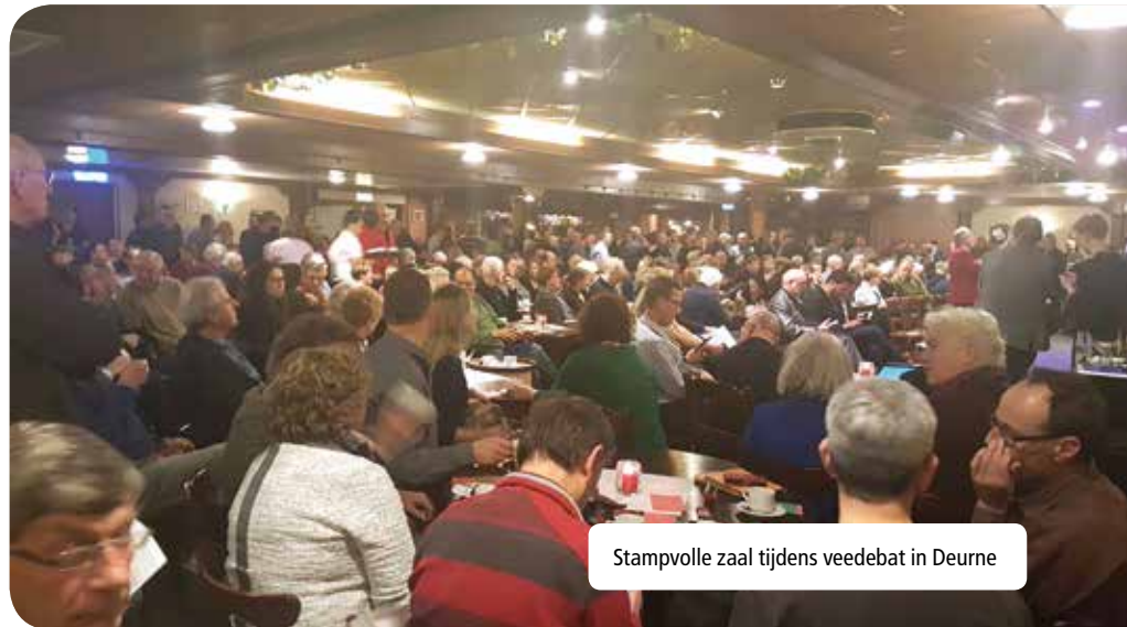
Stampvolle zaal tijdens veedeбат in Deurne