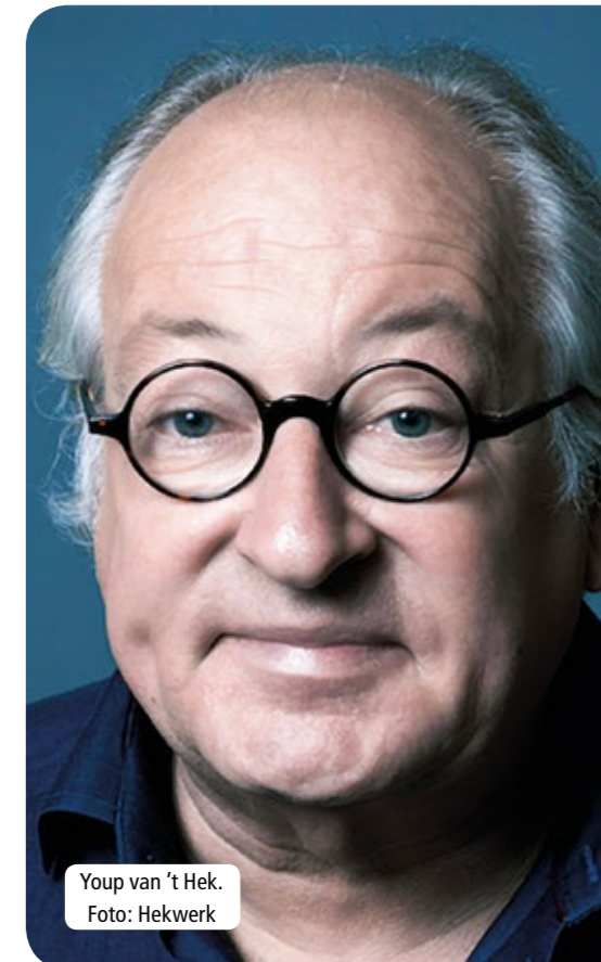
Youp van 't Hek.