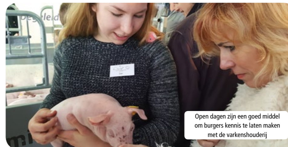
Open dagen zijn een goed middel om burgers kennis te laten maken met de varkenshouderij

De varkenshouderij in Nederland ligt meer en meer onder de kritische loep van de politiek, media en de maatschappij. Varkenshouders begrijpen die toenemende aandacht en nemen hun maatschappelijke verantwoordelijkheid serieus. Politiek, media en maatschappij zullen voor het draagvlak en daarmee het behoud van de varkenshouderij in Nederland echter ook hun rol moeten pakken.