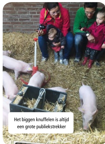
Het biggen knuffelen is altijd een grote publiekstrekker